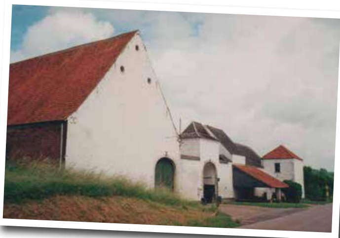
Ferme de Villers