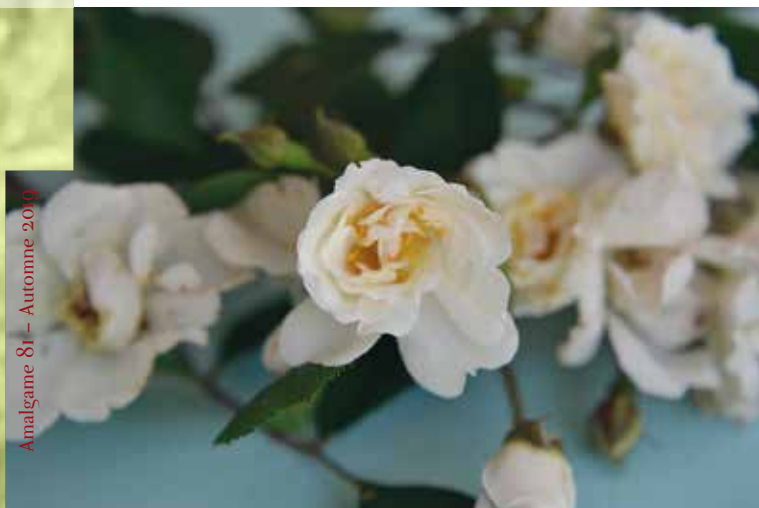
Amalgame 81 - Automne 2019

Contact : yvan.capouet@gmail.com ou colettewoestyn@hotmail.com