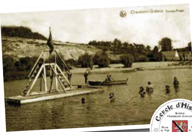
Gistoux – Ronvau Plage